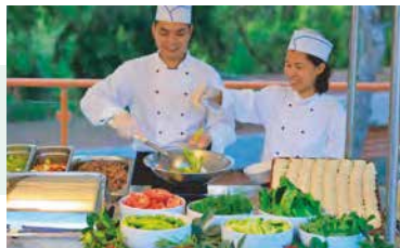
The Baharat (Spice) Bazaar